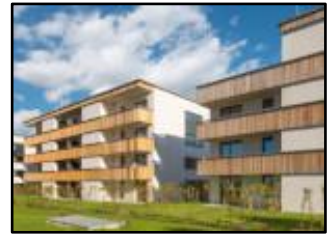
Sozial und hoch energieeffizient: Mehrfamilienhäuser im Passivhaus-Standard.

Fossile Energie einzusparen ist das Gebot der Stunde. Das Passivhaus Institut hat dazu die Aktion #EnergieEffizienzJETZT gestartet. Das Forschungsinstitut erläutert, wie jede/jeder Einzelne von uns dazu beitragen kann, sich von fossiler Energie unabhängiger zu machen und letztlich vollständig darauf zu verzichten. Alle Infos auf der Plattform Passipedia .