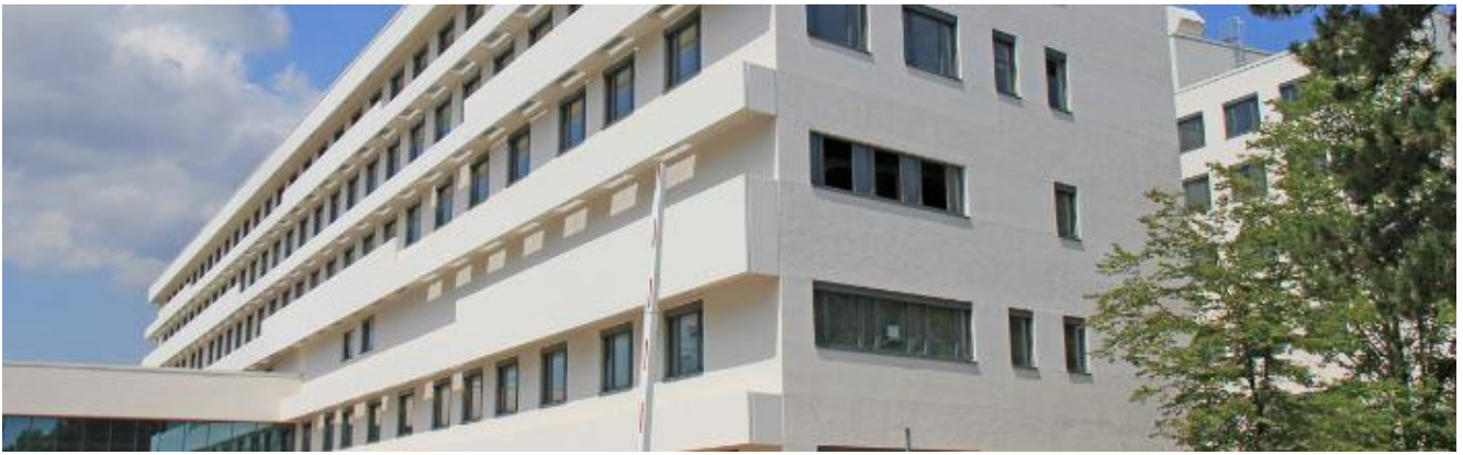
Der Neubau des varisano Klinikums Frankfurt Höchst ist erfolgreich im Passivhaus-Standard realisiert worden. Über 1600 Beschäftigte werden im neuen Gebäude tätig sein.