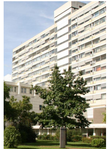
Das Bestandsgebäude des Klinikums aus den 1960er Jahren.

Heilig hatte sich seit den ersten Planungen dafür stark gemacht, den Neubau hoch energieeffizient zu realisieren. „Ich bin daher stolz, dass uns dieser Meilenstein gelungen ist“. komplettem Umfang betrachtet werden. In herkömmlichen Nachweisverfahren werden jedoch lediglich der Energiebedarf für Heizung und Kühlung, Lüftung, Trinkwasser und Beleuchtung betrachtet. Damit bleibt nahezu die Hälfte des tatsächlichen Energiebedarfs bei der Planung unberücksichtigt.