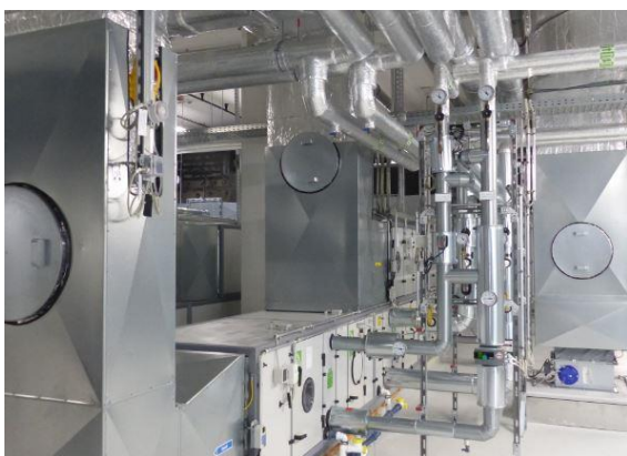
Lüftungsanlagen mit Wärmerückgewinnung im Neubau des Klinikums Frankfurt Höchst. Zudem verfügt jeder Operationssaal über eine eigene Lüftungsanlage.

Die von Patienten als angenehm empfundene erhöhte Raumtemperatur wird aufgrund der guten Energieeffizienz des Gebäudes mit weniger Energieeinsatz erreicht. Für frische Luft sorgen die Lüftungsanlagen. Deren Wärmerückgewinnung unterstützt die Energieeinsparung an Heizwärme. Die im Vorfeld erstellte Grundlagenstudie des Passivhaus Instituts zur Umsetzung des Passivhaus-Konzepts in Krankenhäusern zeigt: Der Heizwärmebedarf kann trotz der höheren Raumtemperatur und trotz des höheren Luftwechsels der kontrollierten Lüftung mit darauf abgestimmten Maßnahmen auf 15 Kilowattstunden pro Quadratmeter Energiebezugsfläche und Jahr (kWh/(m 2 EBF a)) begrenzt werden.