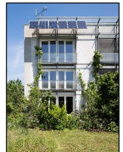
Das weltweit erste Passivhaus in Darmstadt feierte gerade seinen 30. Geburtstag!

Im Winter hält sich die Wärme sehr lange im Haus, da sie nur langsam entweicht. Im Sommer (sowie in warmen Klimaten) ist ein Passivhaus ebenfalls im Vorteil: Dann bewirkt u.a. die gute Dämmung, dass die Hitze draußen bleibt. Eine aktive Kühlung ist daher in Wohngebäuden (in Mitteleuropa) in der Regel nicht nötig. Durch die niedrigen Energiekosten sind die Nebenkosten kalkulierbar - eine Grundlage für bezahlbares Wohnen und sozialen Wohnungsbau. Der Passivhaus-Standard erfüllt die Anforderungen der EU an Nearly Zero Energy Buildings (NZEB).