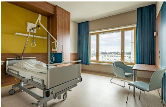
Die Patientenzimmer im Neubau des Klinikums Frankfurt Höchst sind größer. Das erspart allen Beteiligten das Rangieren mit Betten und Geräten.

Die Patientenzimmer seien nun etwas größer und ersparten dadurch allen Beteiligten das Rangieren mit Betten und Geräten, erläuterte Menger weitere Vorteile. Darüber hinaus seien alle Patientenbetten mit Touchscreen-Bildschirmen ausgestattet, die sowohl der medizinischen Betreuung dienen als auch für die Unterhaltung der Patienten genutzt werden könnten. Rosemarie Heilig, Klima- und Umweltdezernentin der Stadt Frankfurt, bezeichnete den Neubau bei der Übergabe des Passivhaus-Zertifikats als „Leuchtturm für alle Krankenhäuser, die in Zukunft gebaut werden“.