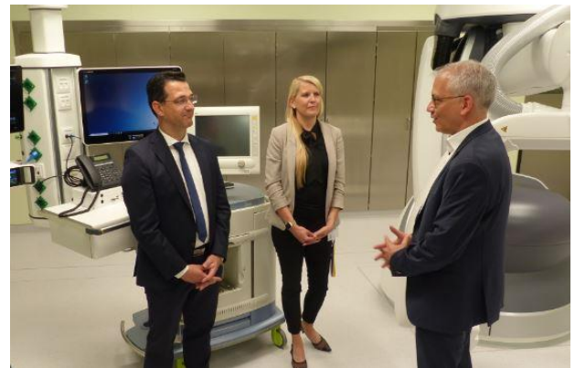
Im Neubau ließ sich Wirtschaftsminister Al-Wazir (r.) den Hybrid-OP mit integrierten bildgebenden Verfahren zeigen.

Die beste Energie sei die, die nicht verbraucht werde, so der Wirtschaftsminister weiter. Hessen setze daher auf Energiesparen, Energieeffizienz und erneuerbare Energien. Das Land habe das Vorzeigebispiel klimafreundlicher Neubauten, dessen energetischer Standard weit über den gesetzlichen Anforderungen liege, gerne begleitet und gefördert. Durch den intensiven 24-Stunden-Betrieb in Krankenhäusern gehören diese zu den Spitzenverbrauchern an Energie: Von der Notaufnahme über die Operationssäle samt Intensivräumen bis zu den Patientenzimmern sind zahlreiche technische Geräte im Einsatz. „Gerade deshalb ist das energieeffiziente Konzept für Krankenhäuser mit ihrem hohen Energiebedarf besonders lohnend. Das gilt für Effizienzmaßnahmen am Gebäude ebenso wie für energieeffiziente technische Geräte“, erläuterte Dr. Jürgen Schnieders von der Geschäftsführung des Passivhaus Instituts. Das Forschungsinstitut in Darmstadt begleitete den Neubau in der Planungs- sowie in der Bauphase.